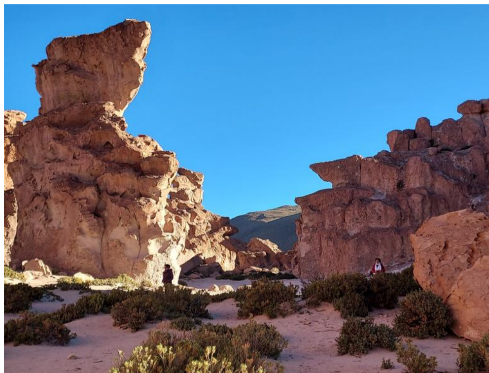
Des formations rocheuses surprenantes.

Pour naviguer dans ce chaos, se déplacer d'un quartier à l'autre, rien de plus simple : il suffit de monter dans l'un des téléphériques qui survolent la ville. Là-haut, la vue panoramique transforme la confusion urbaine en un spectacle grandiose. À peine dix kilomètres plus