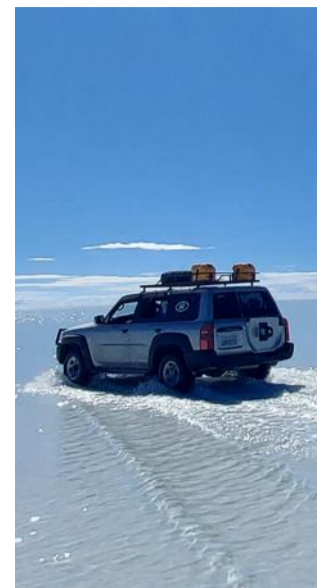
En 4 x 4 sur le plus grand lac salé du monde