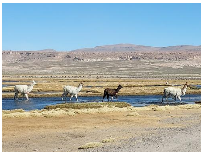
Peu farouches, les lamas sont prioritaires sur les routes.