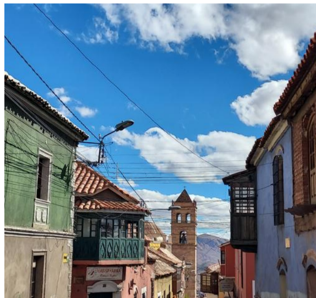
Potosí, la ville la plus haute de Bolivie.