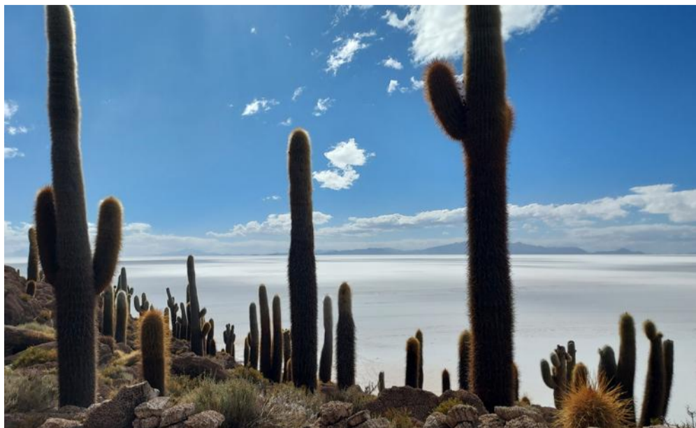
Des cactus sur une île de corail au cœur du lac salé.