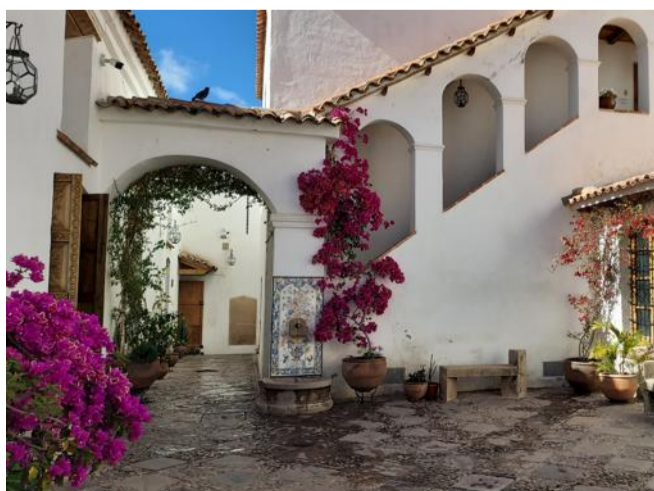
Tout le charme de Sucre.

Ce voyage a été élaboré sur mesure par le tour opérateur « Voyages Définition Amérique Latine » basé à Mulhouse. Pérou - Bolivie, 17 jours au départ de Mulhouse avec le vol international, des vols domestiques, les transports terrestres (train, bus, 4x4), droits d'accès aux différents sites et musées, pension complète, encadrement francophone. Définition Amérique Latine, 13 avenue de Strasbourg, Brunstatt-Didenheim, sur rendez-vous au tél. 03 89 36 10 64. mulhouse@travel-definition.com